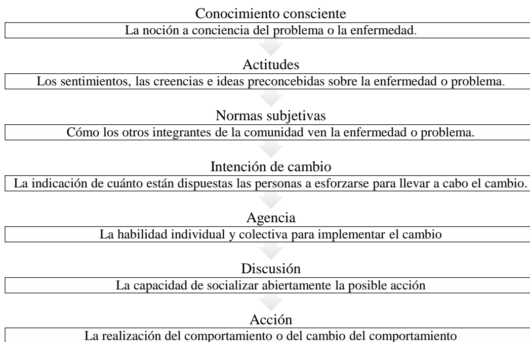
Figura 1. Elementos del modelo CASCADA, 2022